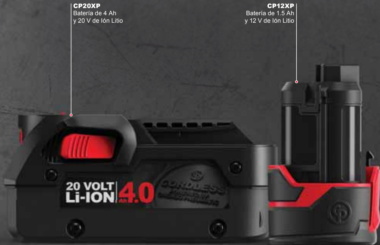
CP20XP Batería de 4 Ah y 20 V de Ión Litio