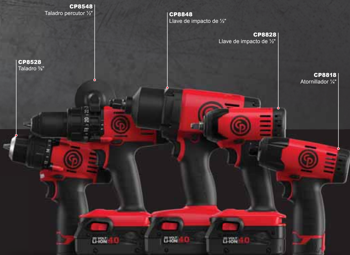
CP8548 Taladro percutor 1/2"